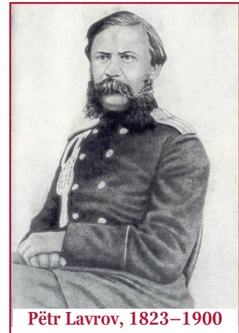
Pëtr Lavrov, 1823–1900

Le 11 février 1900, l'après-midi débute à peine et une foule se presse devant le 328 de la rue Saint-Jacques à Paris. L'appartement que le révolutionnaire russe en exil, Pëtr Lavrov , occupait depuis près de vingt-cinq ans, accueille des visiteurs qui, en dépit du froid, sont venus assister aux funérailles. Décédé le 6 février à 76 ans, Pëtr Lavrov était une figure reconnue, tant en Russie qu'en Occident. Ce socialiste aux idées éclectiques selon le mot d'Engels (Rappoport 1991, 98), marqué par le marxisme à la fin de sa vie, avait élaboré une philosophie qui mettait en avant le progrès, l'individu et l'éthique. Exilé dans la province de Vologda en 1867 pour ses sympathies révolutionnaires, ses