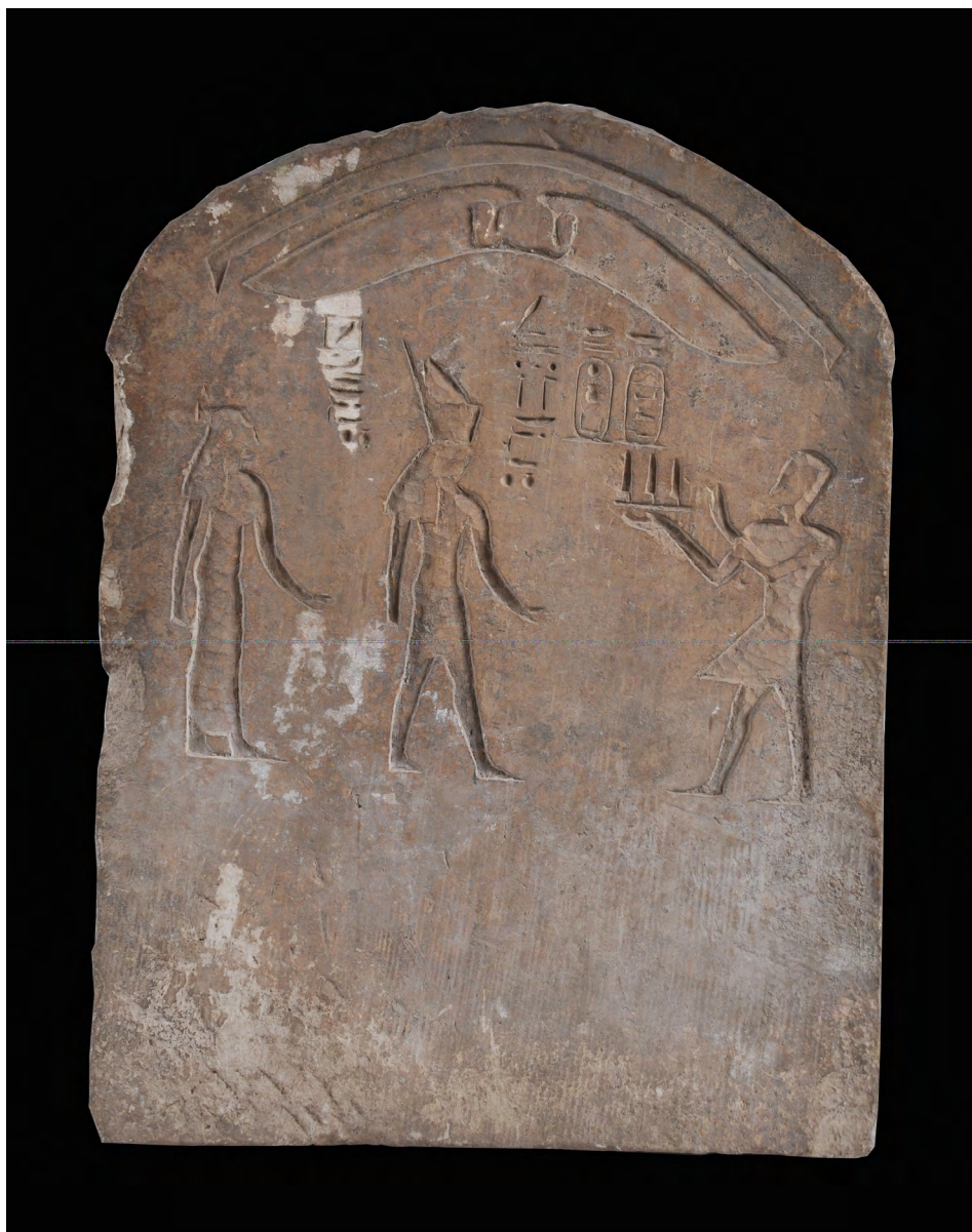
Fig. 1 : Photographie de la stèle Caire 30/8/64/2 par Sameh Abd El-Mohsen.