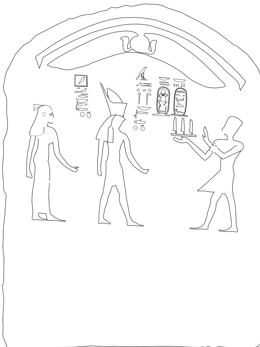
Fig. 2: Fac-similé de la stèle Caire 30/8/64/2 par Nader El-Hassanin.